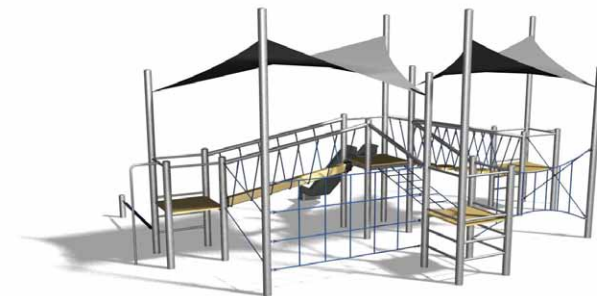
Variante mit integrierten Sonnensegel

Projekt kürzlich realisiert. Fotos werden später ergänzt.