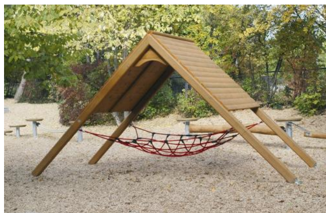
1.02.05.00.I (lasiert / lasuré)

La maisonnette peut être utilisée de manière très variée. Jouer, se cacher et grimper sur le toit. Un sol amortissant est nécessaire, tout autour du jeu!