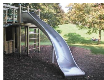
Auf Anfrage mit Edelstahlrutsche/ Sur demande avec toboggan en inox