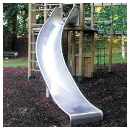
Auf Anfrage mit Edelstahlrutsche / Sur demande avec toboggan en inox