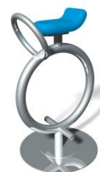
Das Einrad / Le monocycle