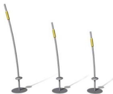
Die Gräser / Les roseaux