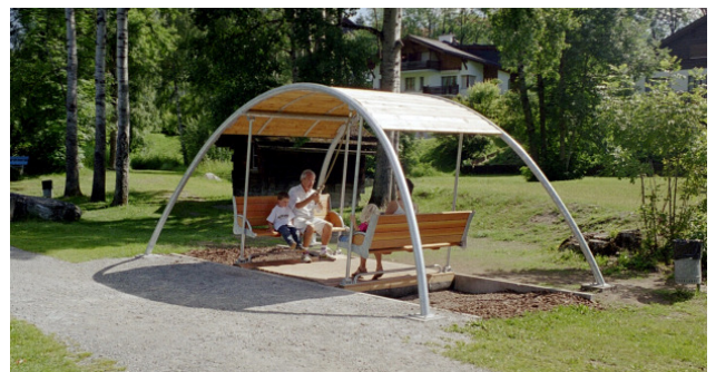
SC.200 Die Gruppenschaukel ist ein Ort der Ruhe und Erholung. Speziell auch für Körperbehinderte, Rollstuhlfahrer und ältere Menschen. Barrierfrei mit schwellenlosem Einstieg. / SC.200 C'est un lieu de repos et de détente. Idéal pour les personnes en chaise roulante ou les personnes âgées. Sans barrière d'accès et sans seuil.