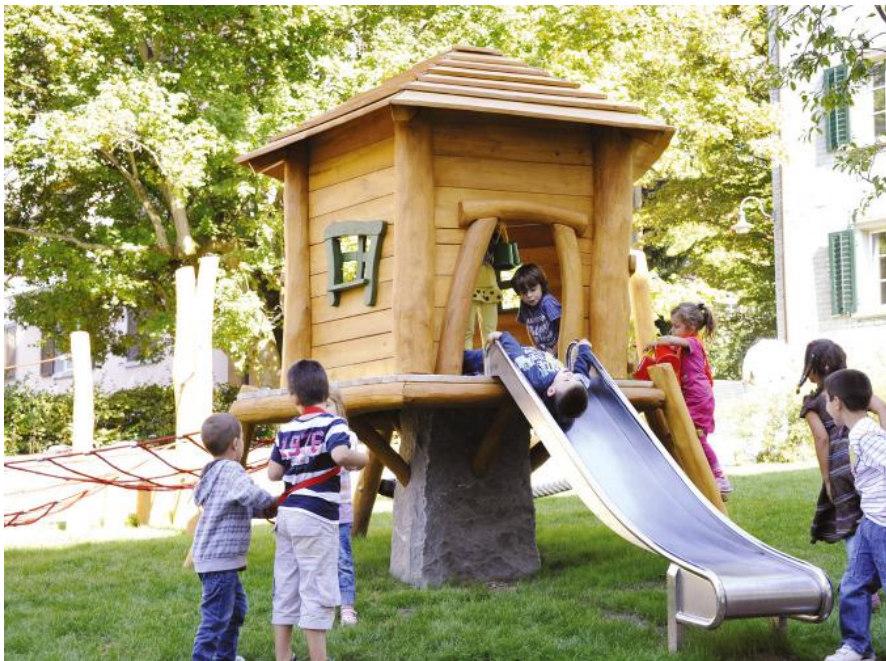
BN.060.01 Hinkelsteinhütte 100 auf Rasen / Cabane de menhir 100 sur gazon

Une véritable rocher constitue la base massive de cette maisonnette unique. Les cabanes de menhir peuvent être utilisées en combinaison avec des passerelles dans la pente ou avec d'autres équipements. Diverses montées d'escalade et descentes sont déjà incluses dans le modèle standard. En bois de robinier massif, croissance naturelle, non traité. Cordes armées antivandalisme. Parties métalliques en inox. Sur demande: surface du bois lasurée écologiquement. *Chaque produit est unique. Adaptations réservées. Le bois est un produit naturel - des fissures sont inévitables*