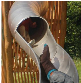
BN.132.2.s Inox Kurvenrutsche