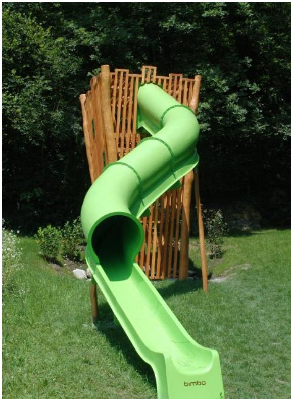
BN.132.1.s (style) mit GFK Kurvenrutsche / avec Toboggan GFK Spezial in Hanglage / Spéciale sur un talus

Un nouveau géant avec beaucoup de valeur ludique. Une belle descente récompense l'effort de grimpe. L'accès intérieur et les filets offrent une grande sécurité. La transparence de la construction a de nombreux avantages. Exécution en robinier, mélèze/ pin douglas. Cordes armées. Variante style: paroi semi-transparente avec lattes en bois de douglas massif. Variante nature: construction avec des planches de robinier massif disposées „sauvagement“. Exécution avec poteaux en métal, sur demande.