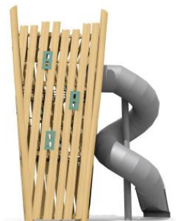
BN.132.4.n (nature) Wild, natürlich / Sauvagement