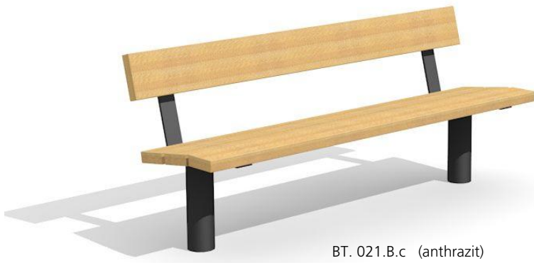
BT. 021.B.c (anthrazit)

Construction massive, confortable et durable. A bétonner. Lattage en bois de douglas Suisse, non traité. Sur demande, lattage lasuré ou bois dur. Châssis zingué à chaud ou couleur anthracite. Exécutions sur mesure, sur demande. Une apparition de sève n'est pas exclue les premiers temps.