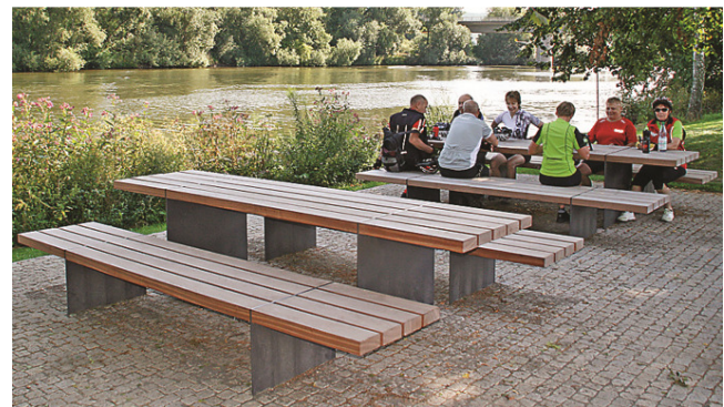
MO.17.32.r (Teilrückenlehne rechts / dossier partiel à droite)