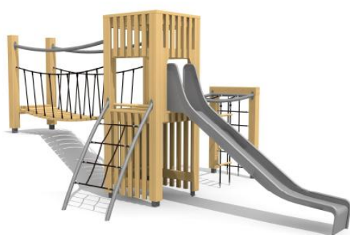
BXS.110.1 an Hügel