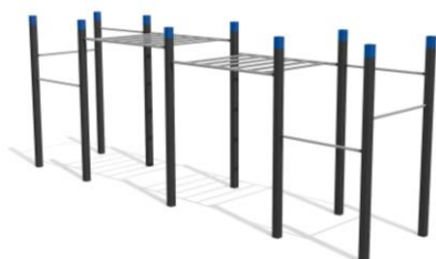
DS.4203 Street Workout 203 Platzbedarf / Place 1105 x 545 cm