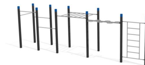
DS.4509 Streetworkout 509 Platzbedarf / Place 1150 x 450 cm