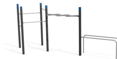
DS.4603 Street Workout 603 Platzbedarf / Place 990 x 640 cm