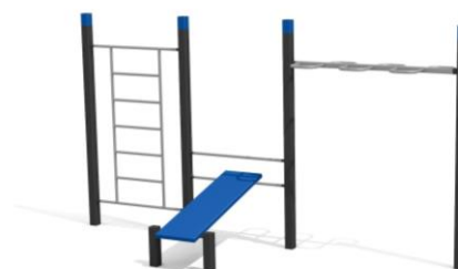
DS.4602 Street Workout 602 Platzbedarf / Place 800 x 470 cm