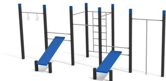
DS.4508 Street Workout 508 Platzbedarf / Place 1010 x 695 cm