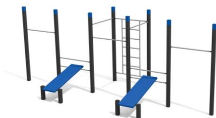
DS.4504 Street Workout 504 Platzbedarf / Place 1010 x 695 cm