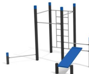
DS.4506 Street Workout 506 Platzbedarf / Place 645 x 645 cm