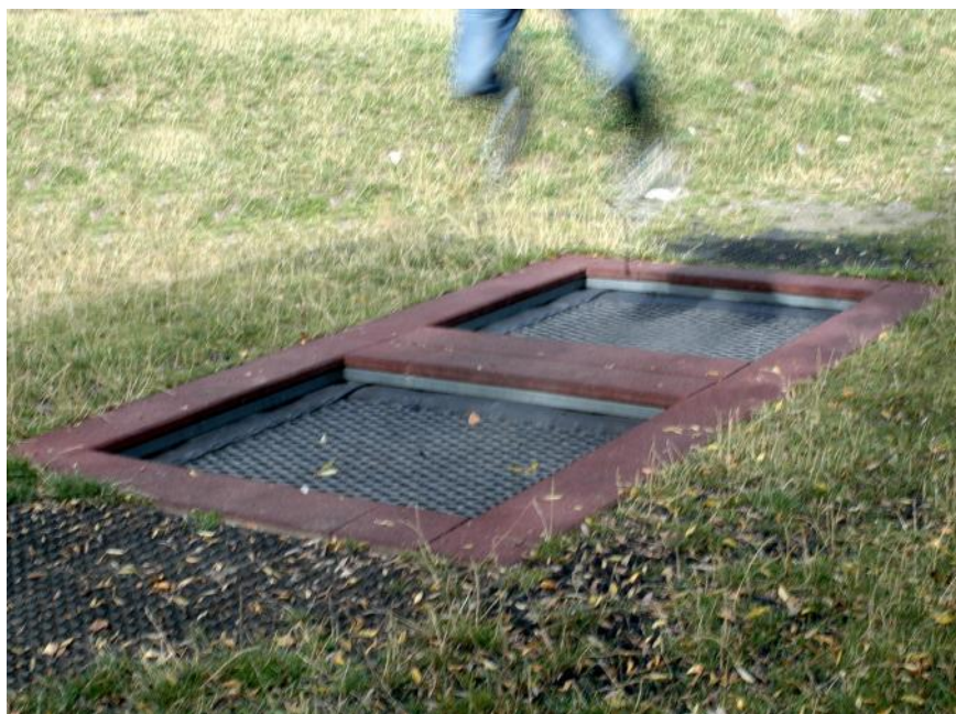
M2 FA.093.2 & FA.090.12

Les groupes de trampolines permettent de nombreuses variantes de jeu. Ils ont été développés pour être soumis à des efforts permanents et ont fait leurs preuves depuis des années. Pour des raisons de sécurité la hauteur du saut est moindre qu'avec un trampoline normal. Tapis en caoutchouc recyclé pratiquement indestructible. Bord en caoutchouc, noir, inclus (disponible aussi en rouge). Pour une installation avec des sols coulés, il est livrable sans bord en caoutchouc. Sur demande, avec un cadre à enterrer en métal.