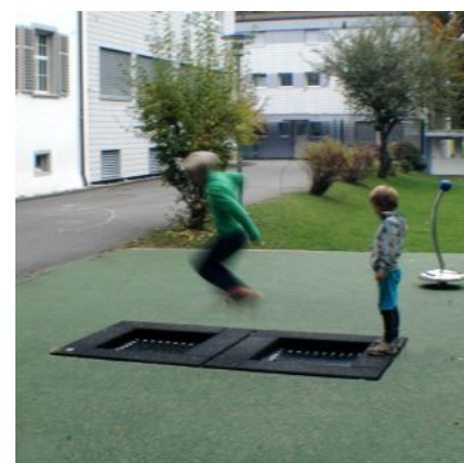
S2 FA.090.1 & FA.093.12