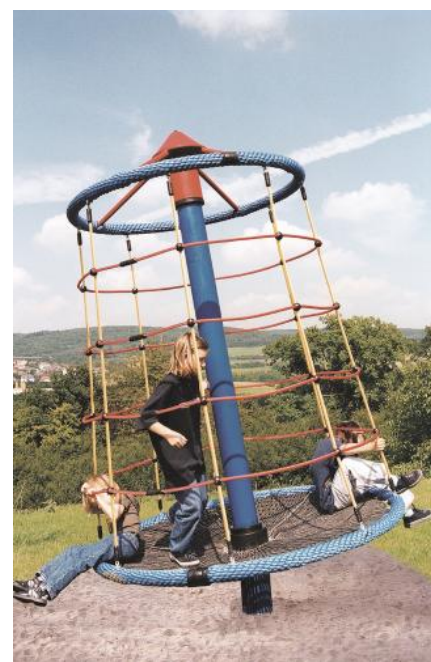
FA.060.1 (zum Eingraben / à enterrer)