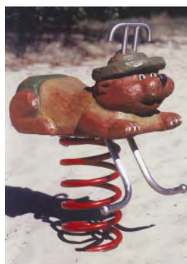
Der Bello Bär / L'ours FG.080.205