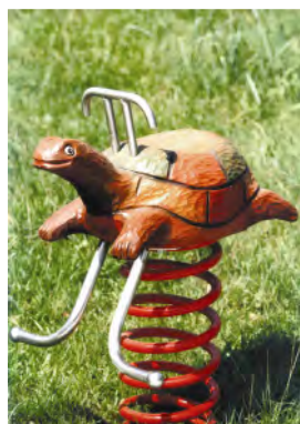
Die Schildkröte / La tortue FG.080.209