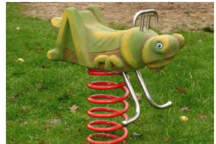
Die Heuschrecke / La sauterelle FG.080.203