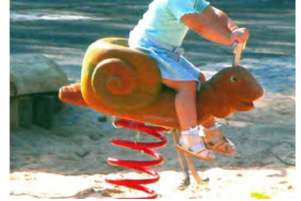
Die Schnecke / L'escargot FG.080.216