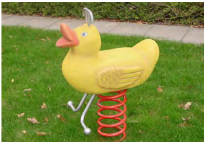
Entchen / Caneton FG.080.220