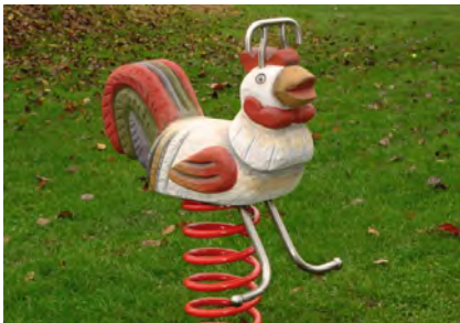
Der Hahn / Le coq FG.080.217