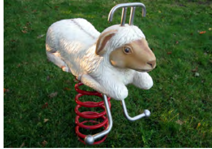
Schäfchen / Le mouton FG.080.222