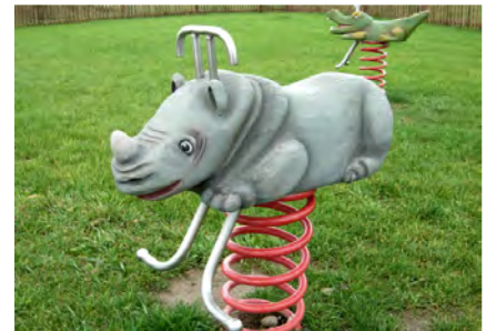
Das Nashorn / le rhinocéros FG.080.219