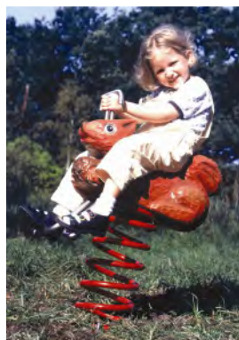
Das Eichhörnchen / L'écureuil FG.080.204