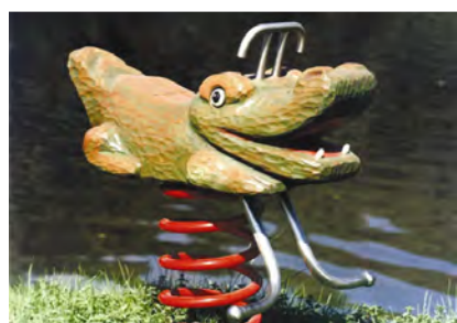
Der Dino / Le dino FG.080.208