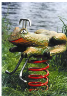
Der Frosch / La grenouille FG.080.206