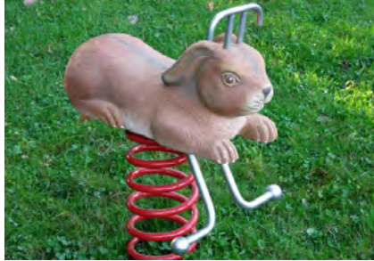
Häschen / Le lièvre FG.080.221

Notre assortiment de jeux sur ressort en bois massif sont sculptés main. La partie supérieure est construite en bois massif. La surface est lasurée écologiquement, sur demande sans lasure. La partie inférieure comprend les ressorts habituels. Socle d'ancrage inclus. Ressort gris ou sur demande rouge. *Le bois est un produit naturel - des fissures sont inévitables*