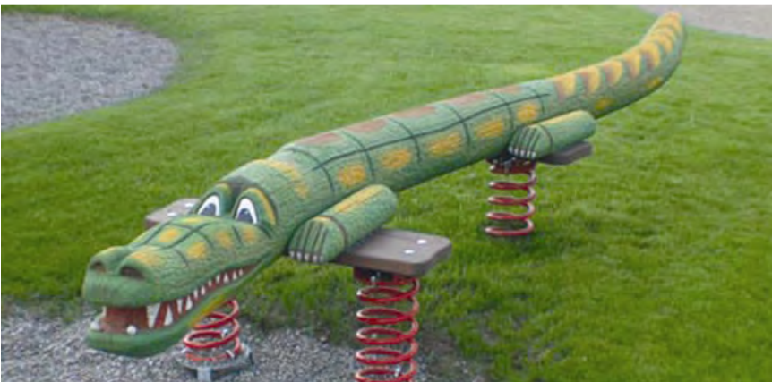
Das grosse Krokodil / Le grand crocodile (450 x 100 x 60 cm) FG.080.215