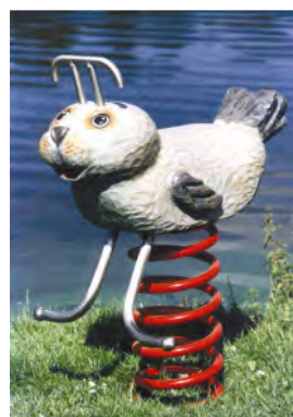
Die Robbe / Le phoque FG.080.213