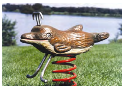
Der Delfin / Le dauphin FG.080.211