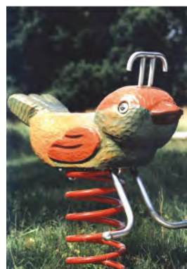
Der Vogel / L'oiseau FG.080.202