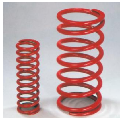
FG.Z11.1 / FG.Z11.2 Ersatzfeder klein/gross in Spezialfederstahl Ressorts standard, en acier spécial