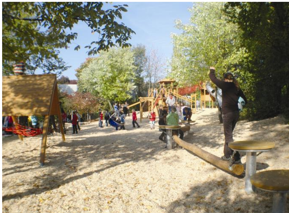
*Einzigartig* - idéal für leichte Hanglagen / *Unique* - idéal pour les pentes douces