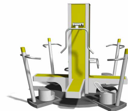
Kompakte platzsparende Versionen / Des versions place restreinte