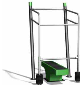
Einzelgeräte mit oder ohne Boden / Avec ou sans planchers