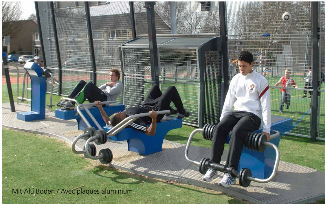
Mit Alu Boden / Avec plaques aluminium

Fitness-Studio für draussen. 14 unterschiedliche Kraft- und Cardiogeräte. Die Version mit den integrierten Bodenplatten ermöglicht es, die Geräte ohne zusätzlichen Befestigungen aufzustellen. Ob in einem vorgegebenen Trainingsablauf, kreisförmig oder einzeln platziert. Die Anordnung und Farbgebung kann individuell gestaltet werden.