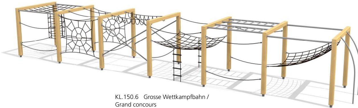
KL.150.6 Grosse Wettkampfbahn / Grand concours

Le nouveau système de grimpe modulaire de bimbo offre de nombreux défis. La variante haute est conçue pour les plus grands. Design moderne avec beaucoup de valeur ludique. Le choix des matériaux permet une longévité optimale. En bois de douglas naturel Suisse. Consoles en acier galvanisé à bétonner. Barres et pièces de raccord en inox. Cordes armées antivandalisme. Exécutions sur mesure, sur demande