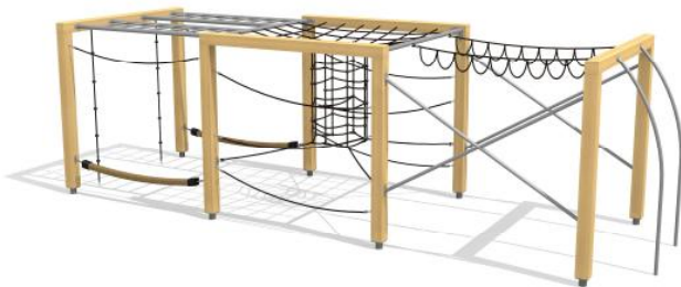
KL.150.4 Wettkampfbahn / Concours