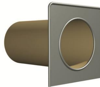
RU.082.40 & RU.082.45