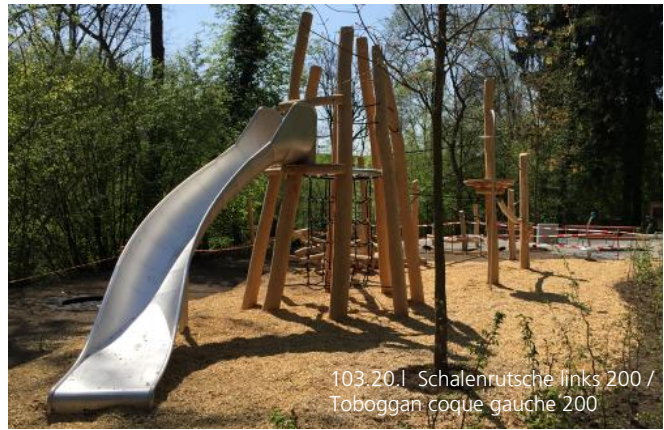
103.20.1 Schalenrutsche links 200 / Toboggan coque gauche 200