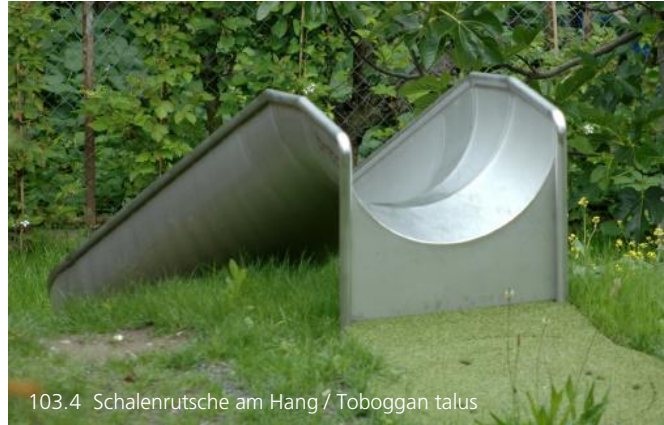
103.4 Schalenrutsche am Hang / Toboggan talus