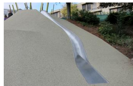
103.4 Schalenrutsche Spezial / Sur mesure