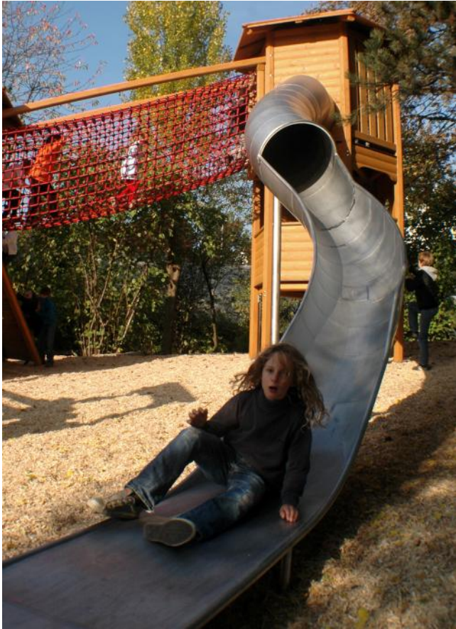
103.5 Röhren-Schalenrutsche / Toboggan tunnel coque

Les toboggans sur mesure adaptés à votre projet sont créés précisément avec un dessin 3D CAD.