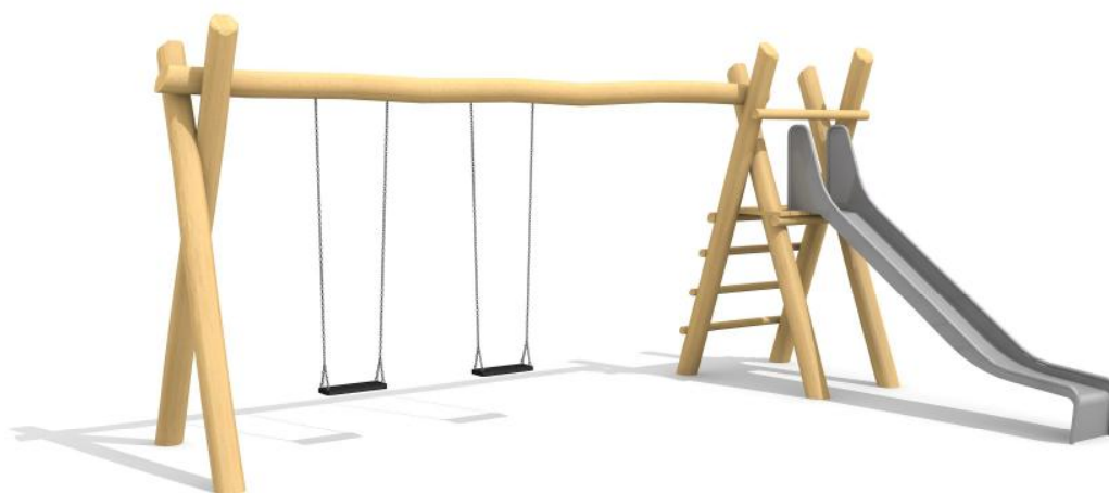
SC.060.2.r (nature) & BS.010.52 Edelstahlrutsche / Toboggan en inox

Une combinaison de jeu compacte et simple. En bois massif avec angles en métal zingués à chaud. Espalier en bois dur. Toboggan ondulé en polyester, vert, autres couleurs, selon le tableau des couleurs. Siège de sécurité avec noyau métallique et chaînes en inox. Suspension bimbo sans graissage. Variante classic: en bois de sapin blanc imprégné, socle en métal inclus. Variante nature: en bois de robinier massif, croissance naturelle, non traité. Sur demande surface lasurée.