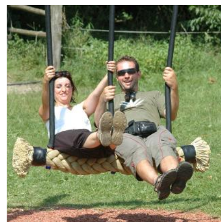
Auch bei Erwachsenen äusserst beliebt / Également apprécié par les adultes