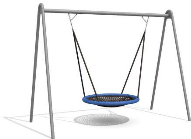
SC.130.3, Ø 120 cm

Doubler le plaisir en se balançant ensemble ou s'y coucher et se balancer doucement en rêvant. Armature en tube de métal zingué à chaud. Suspension bimbo sans graissage. Balançoire en métal avec panier en corde et cordes de suspension avec intérieur en acier. Hauteur de suspension 240 cm. Variante steel: armature zingué. Variante color: armature tubulaire en métal zingué et laquée selon le tableau des couleurs.