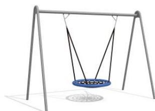
SC.130.1, Ø 100 cm