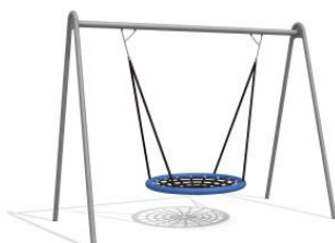
SC.130.2, Ø 120 cm