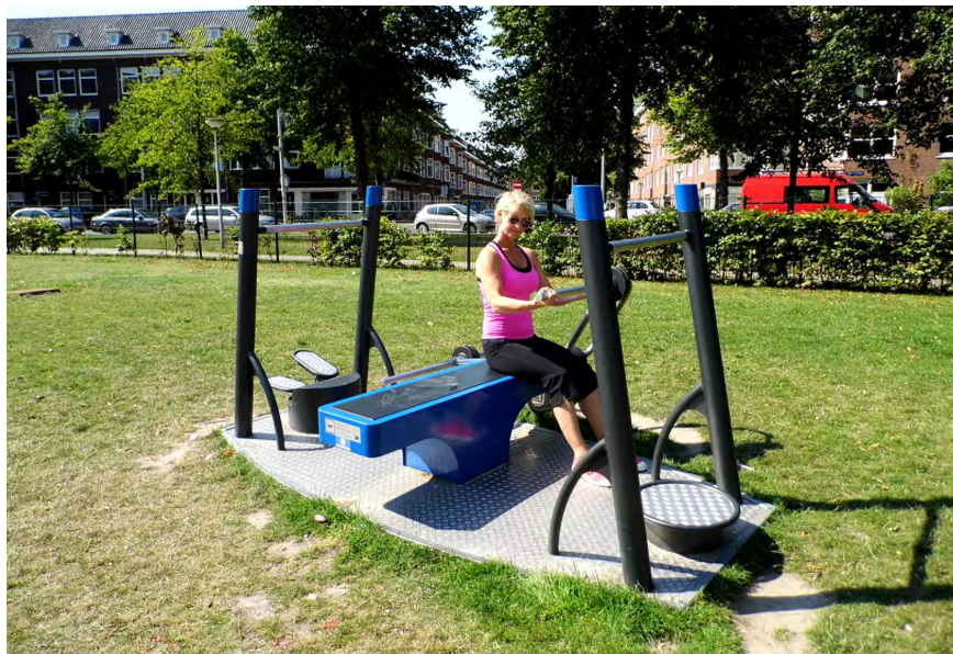
SF.3030 + SF.Z05

Engins d'entraînement compacts. Mode d'emploi inclus. Construction extrêmement solide avec roulements ne nécessitant que peu d'entretien. Couleur selon charte. Plaques de sol en alu. En version pose libre ou à visser.