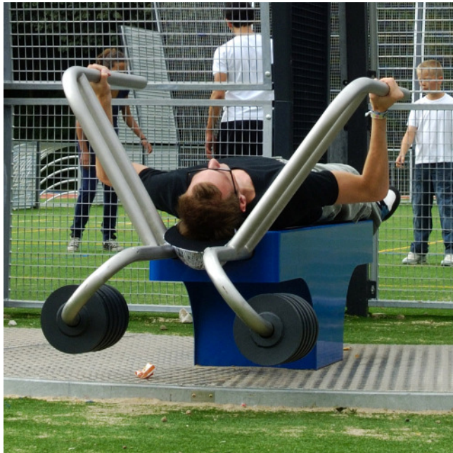
SF.1107 Schulter, Brust und Trizeps durch hochdrücken / Epaules, pectoraux et triceps par pression vers le haut

Entraînement outdoor attractif. Engins professionnels avec poids réglables. Construction extrêmement solide avec roulements ne nécessitant que peu d'entretien. Exécution en acier avec éléments en inox. Mode d'emploi, inclus. Couleur selon charte. La version avec plaque de sol en caoutchouc peut se monter en pose libre.