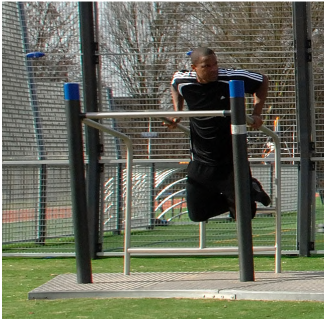
SF.1101 Brust- und Armtraining / Pectoraux et bras

Entraînement outdoor attractif. Engins professionnels avec poids réglables. Construction extrêmement solide avec roulements ne nécessitant que peu d'entretien. Exécution en acier avec éléments en inox. Mode d'emploi, inclus. Couleur selon charte. La version avec plaque de sol en caoutchouc peut se monter en pose libre.