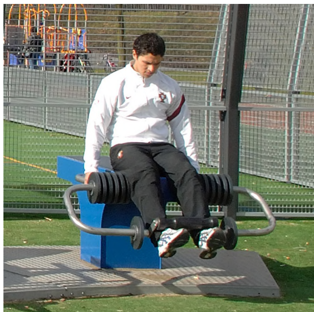
SF.1102 Oberschenkel / Cuisses