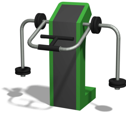
SF.1103 Bizepstrainer / Biceps

Entraînement outdoor attractif. Engins professionnels avec poids réglables. Construction extrêmement solide avec roulements ne nécessitant que peu d'entretien. Exécution en acier avec éléments en inox. Mode d'emploi, inclus. Couleur selon charte. La version avec plaque de sol en caoutchouc peut se monter en pose libre.