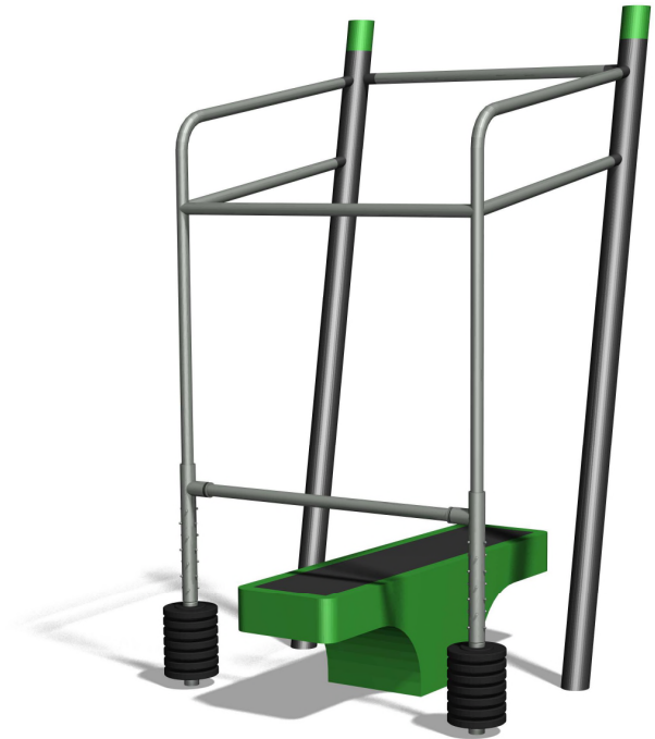
SF.1106 Brust, Schultern, Trizeps / Pectoraux, épaules et triceps