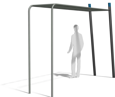
TF.5022 Bauch, Schultern, Arme / Abdos, épaules et bras

L'échelle horizontale est un classique exigeant et un parfait engin d'entraînement. Avec mode d'emploi clair. Version steel : poteau zingué et couleur selon charte. Version nature : poteaux en bois de robinier massif naturel.