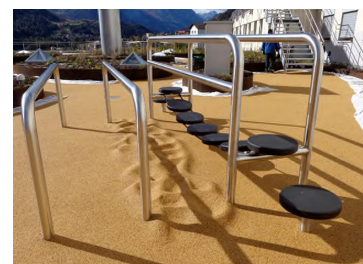
VP.062 Therapieweg nach Mass / VP.062 Parcours de thérapie spéciale