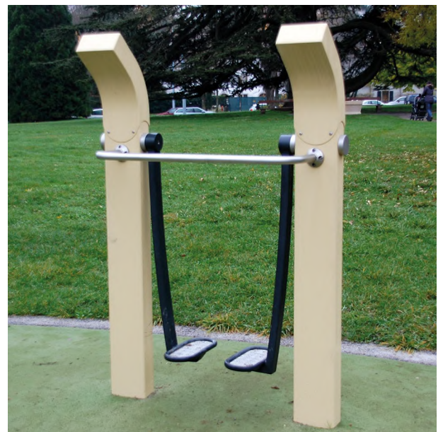
UF.6019 Angenehme Vorwärtsbewegung / Mouvement avant-arrière doux