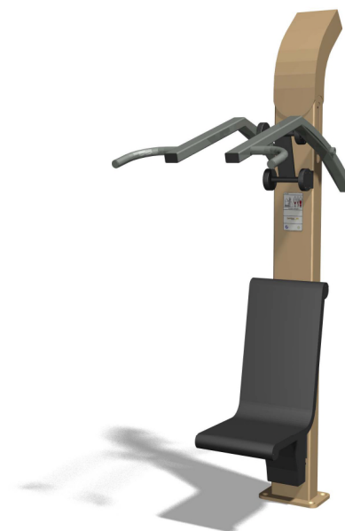
UF.6012 Ergänzungstraining zu Brustdrücker / en complément au powerpush