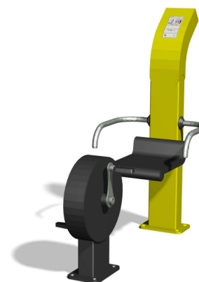
UF.6421 Erhöhte Sicherheit durch Haltegriffe / Plus de sécurité avec les poignées