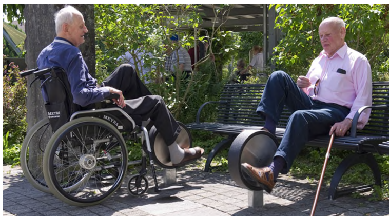
UF.6070 Schonende Bewegung für die Beine, ohne Bank / Mouvements doux pour les jambes, sans banc

Entraînement facile pour tous. Mouvements guidés avec peu d'efforts. Roulements avec un minimum d'entretien. Exécution en acier avec éléments en inox. Instructions d'exercices intégrées. Variante steel: console en acier, couleur selon charte. Variante nature: en combinaison avec un poteau en bois dur croissance naturelle.