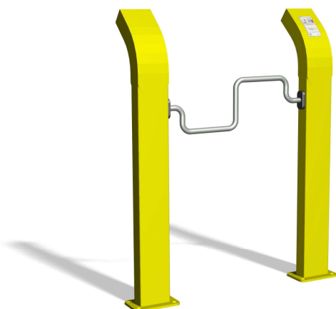
UF.6118 Leichtes Schultertraining / Entraînement doux des épaules

Entraînement facile pour tous. Mouvements guidés avec peu d'efforts. Roulements avec un minimum d'entretien. Exécution en acier avec éléments en inox. Instructions d'exercices intégrées. Variante steel: console en acier, couleur selon charte. Variante nature: en combinaison avec un poteau en bois dur croissance naturelle.