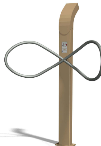
UF.6084 Nackenübung und Konzentration / Exercice pour la nuque et concentration