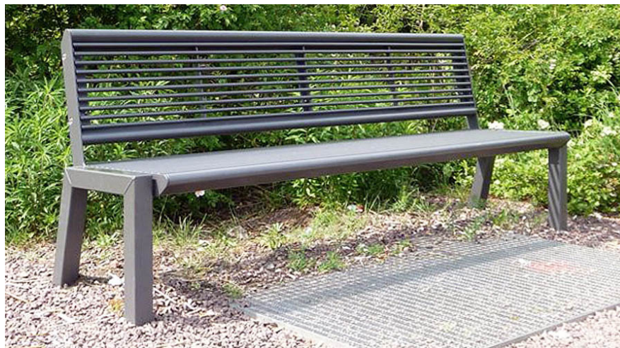
MO.12.02.m anthrazit / anthracite

Robuste - résistant aux intempéries - design actuel. Armature en métal galvanisé et laquée gris argenté ou anthracite. Sur demande en acier inoxydable ou en couleur RAL.