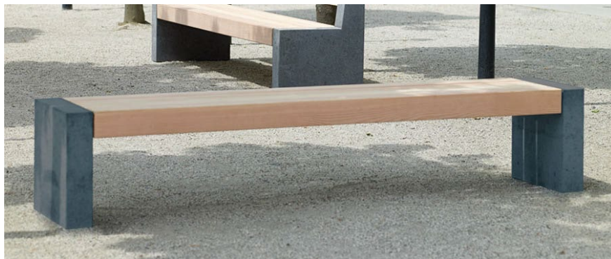
BT.151.H.30 Beton dunkel / Beton foncé

Une nouvelle idée exceptionnelle. Robuste et résistant. Armature Standard en béton clair ou sur demande en béton foncé. Lattage en bois de douglas/mélèze. A visser sur terrain ou à bétonner. Sur demande lattage en bois dur FSC, non traité.