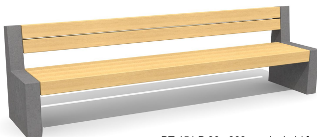
BT.151.B.30 300 cm dunkel / foncé