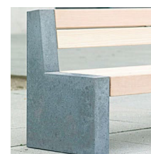
Beton dunkel / foncé