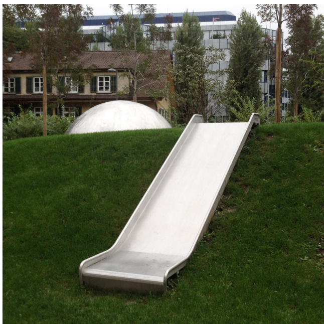
RU.090.25 breit Spezialausführung ohne erhöhte Seiten

Lors du placement des toboggans en inox ouverts, la direction de glissade entre le sud-est et le sud-ouest devrait, si possible, être évitée.