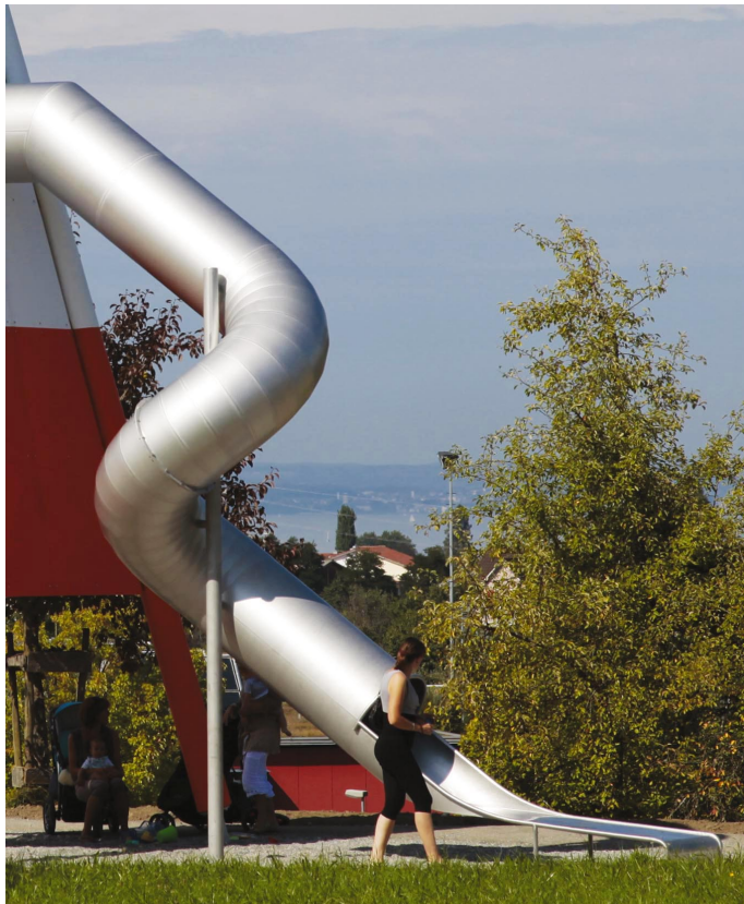
100.55 Röhren-Wendelrutsche 350 mit verlängertem Auslauf / Toboggan-tunnel en spirale 350 avec sortie prolongée

Les toboggans sur mesure adaptés à votre projet sont créés précisément avec un dessin 3D CAD.