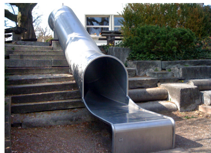
100.5 Röhrenrutsche flach über Treppe / Toboggan-tunnel par-dessus un escalier