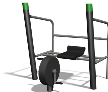
SF.1113 Sport Biker / Sport Bike

Alter / Age 14+ Trainingseffekt Kardio, Fitness, Kraft, Abnehmen, Senioren Effet de l'entraînement Cardio, rester en forme, force, perdre du poids, âgées