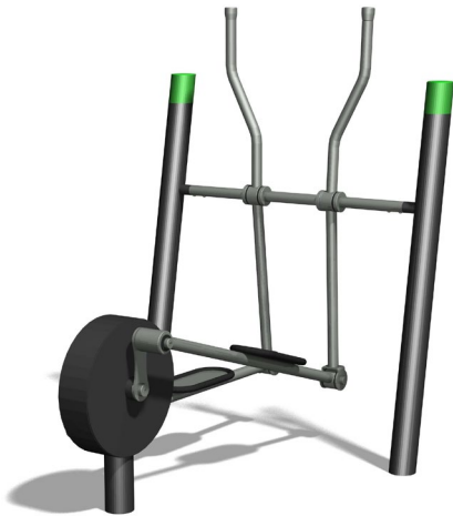
SF.1112 Sport Crosstrainer / Sport Crossfit

Entraînement outdoor attractif. Construction extrêmement solide avec roulements ne nécessitant que peu d'entretien. Exécution en acier avec éléments en inox. Mode d'emploi, inclus. Couleur selon charte. Version avec plaque de sol en caoutchouc.