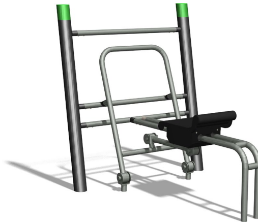
SF.1111 Sport Ruderer / Sport Row