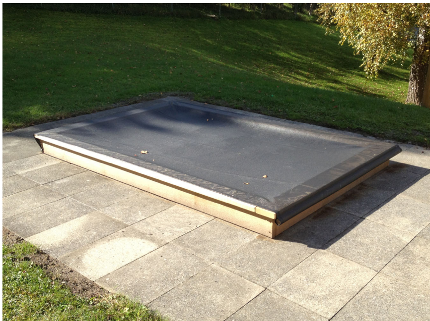
Abdeckplane mit Aufrollstange / Bâche avec barre d'enroulement

Dans la mesure du possible, les bacs à sable devraient être couverts. Le mieux est de fixer la bâche sur un côté. Une barre permet de la rouler et de la dérouler facilement. Il est également possible de tendre la bâche avec un élastique de caoutchouc fixé sur des rouleaux de fixation. Bâche perméable en toile polyéster anti-UV, avec ourlet renforcé.