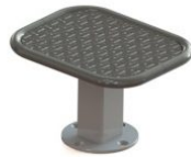
SWC.4964 Jump Platform 300 M/D 50 x 40 x 30 cm H 30 cm