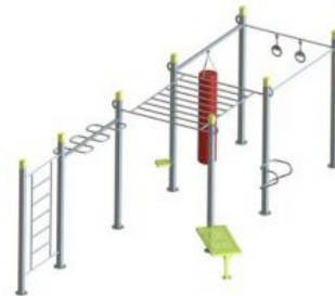
SWC.4967 HIT Training 967 M/D 810 x 341 x 270 cm H 140 cm