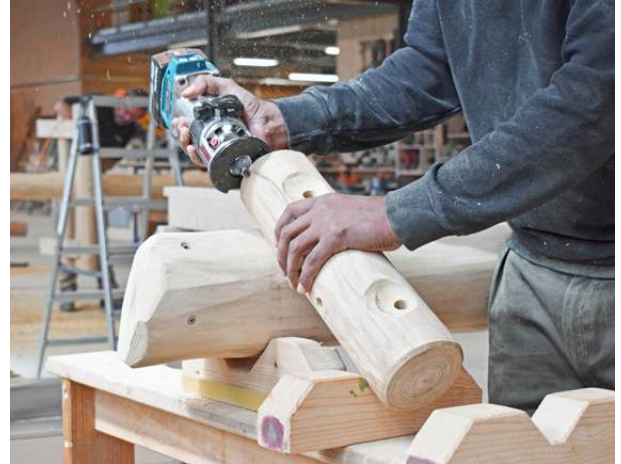
Herstellung & Realisierung