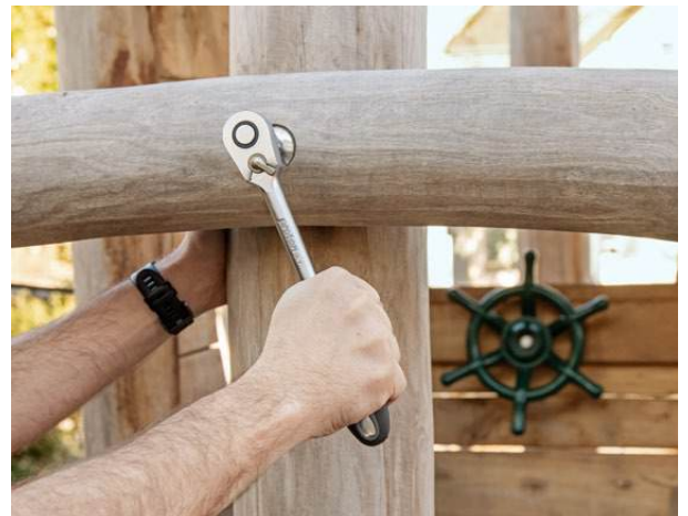
Reparatur & Unterhalt