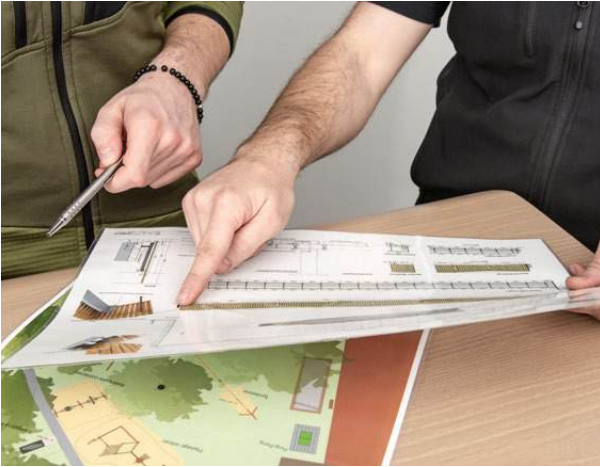
Planung & Entwicklung