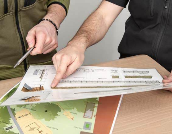
Planification & développement