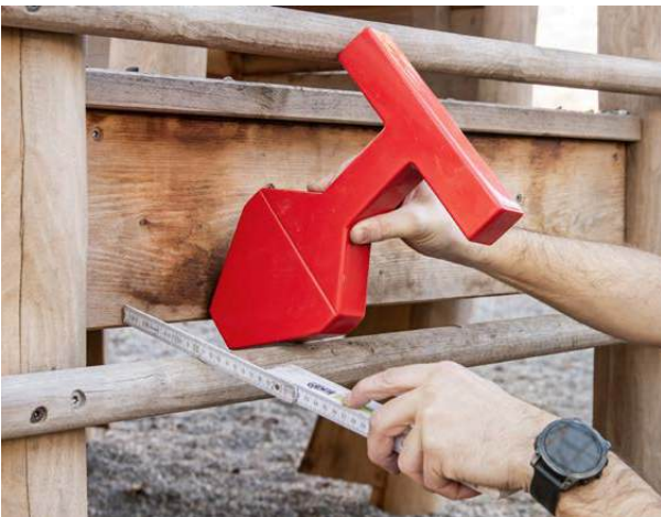
Sécurité & suivi de chantier