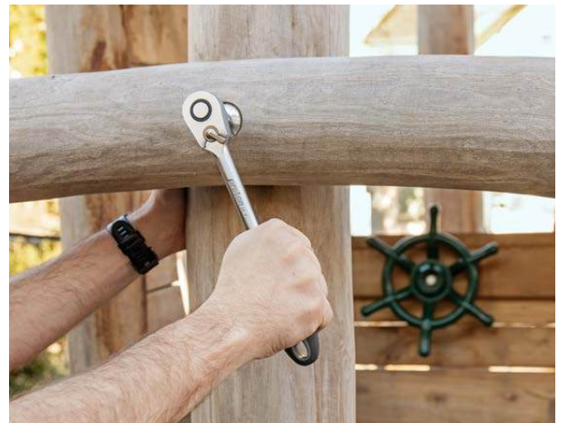
Réparation & entretien