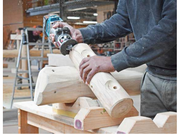
Fabrication & réalisation