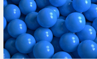
SOPR.049 Ballbad blau *SONDERANGEBOT NEU*