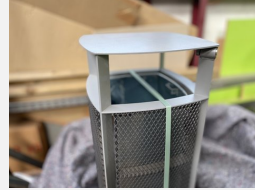
SOPR.060 Abfallbehälter Diagonal Gitter - Sonderangebot