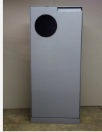
SOPR.040 Abfalleimer Crysta -