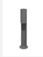
SOPR.056 Standascher Legio -