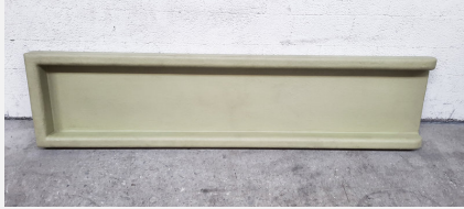
SOPR.050 Wasserrinne aus GFK - Sonderangebot