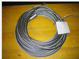
SOPR.005 Seilbahnkabel - Sonderangebot