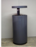
SOPR.041 Abfalleimer Lune flach -