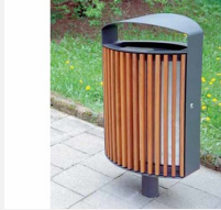
SOPR.043 Abfalleimer Lena - Sonderangebot