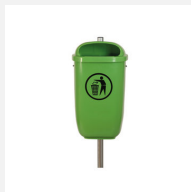
AB.02.13.00 Abfallbehälter DIN 50 L, mit Pfosten