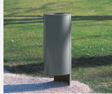
SOPR.042 Abfalleimer Legio - Sonderangebot