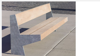
SOPR.038 Bank Versio Juno - Sonderangebot