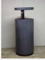
SOPR.041 Abfalleimer Lune flach -