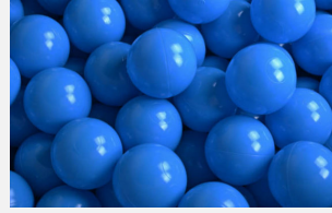
SOPR.049 Ballbad blau *SONDERANGEBOT NEU*