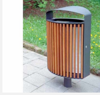
SOPR.043 Abfalleimer Lena - Sonderangebot