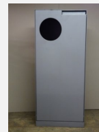
SOPR.040 Abfalleimer Crysta -