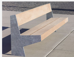
SOPR.038 Bank Versio Juno - Sonderangebot