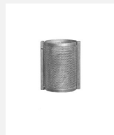
AB.02.22.03 Abfallbehälter M50, Wand