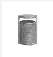
AB.02.22.04 Abfallbehälter M50, Wand mit