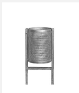
AB.02.22.01 Abfallbehälter M50, Stand