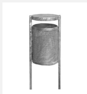
AB.02.22.02 Abfallbehälter M50, Stand mit