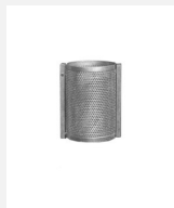
AB.02.22.03 Abfallbehälter M50, Wand