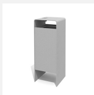
AB.041.10.A Verso quader 50 L mit Ascher verzinkt